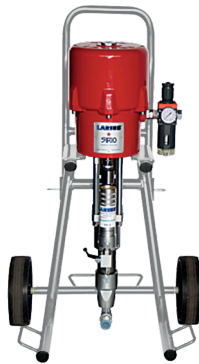
Hydro Clean Inox Sirio 32:1

Air consumption at 60 cycles/min: 3 bar 500 l/m 5 bar 840 l/m 7 bar 1200 l/m