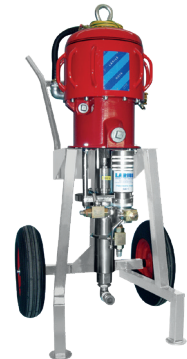
Hydro Clean Inox Nova 20:1 - 30:1 - 45:1

Air consumption at 60 cycles/min: 3 bar 1100 l/m 5 bar 1800 l/m 7 bar 2500 l/m