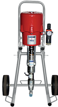
Hydro Clean Inox Sirio 32:1

Consumo aria a 60 cicli/min: 3 bar 500 l/m 5 bar 840 l/m 7 bar 1200 l/m