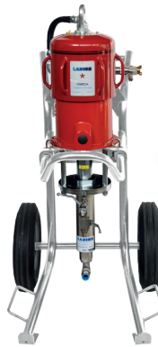
Hydro Clean Inox Omega 15:1- 23:1 - 34:1

Air consumption at 60 cycles/min: 3 bar 760 l/m 5 bar 1260 l/m 6 bar 1760 l/m