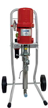
Hydro Clean Inox Ghibli 10:1

18024 Tubo antipulsazioni antistatico Ø 1/4" raccordato 1/4" GAS mt.15 - 70005 Visiera protettiva in policarbonato